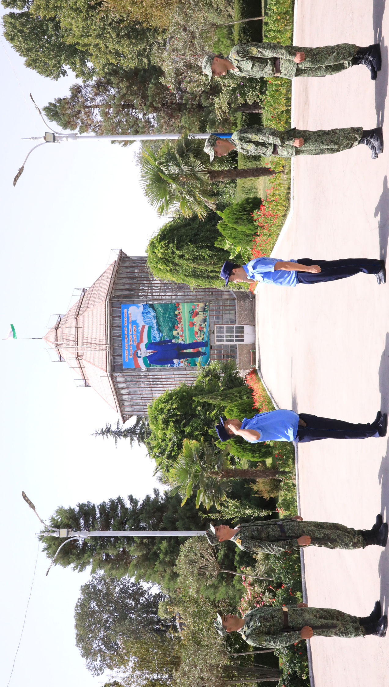
Ивазшавити Қаровулулар Боғи «Иррама»