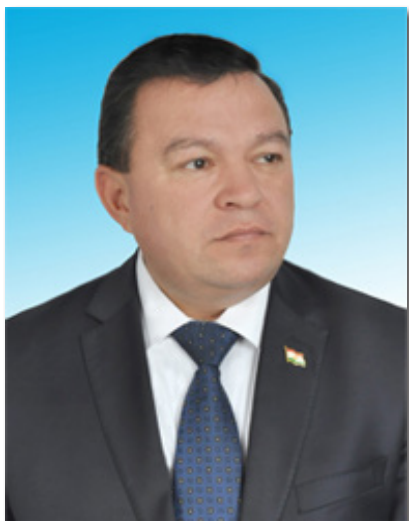
Фарҳод РАҲИМӢ, президенти Академияи илмҳои ҶТ, академик

Тоҷикистон мисли Афғонистон майдони тохтутозҳои худхонону бегонагон мешуд. Ба ин масъала сарсарӣ ва сатҳӣ набояд нигарист. Ҷумҳурии Исломии Афғонистон наздик ба 200 соли охир дар оташи даргириҳои дохилӣ месӯзад ва ба ҷойи хомӯш шудан низоъҳо аз нав шӯълавар мешаванд ва мардуми минтақаро дар мусибату фоҷеа ниғаҳ медоранд. Саъю талошҳои ҷомеаи маданияи Афғонистон самар намедиҳанд, рӯз ба рӯз оташи ҷангу хунрезӣ ва даҳшату ваҳшат густурда мешавад. Мардумони Афғонистон дар орзуи сулҳу ваҳдат ба сар мебаранд.